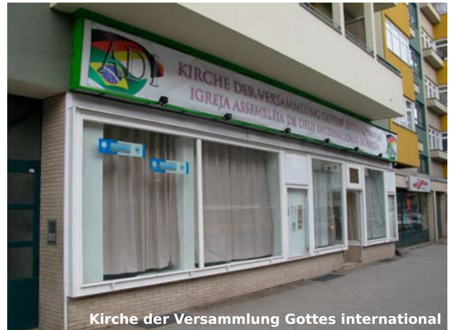
Kirche der Versammlung Gottes international