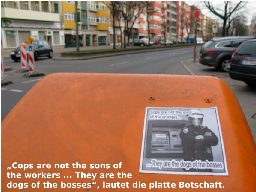
„Cops are not the sons of the workers ... They are the dogs of the bosses“, lautet die platte Botschaft.